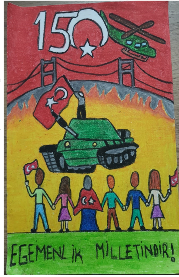
15 TEMMUZ' DA MİLLÎ BİRLİK

15 Temmuz 2016 gecesi yani bundan yaklaşık 5 yıl önceki darbe girişiminde ne mi oldu? Türk halkı hep birlikte içindeki vatan sevgisiyle 251 kişi şehit oldu, 2734 kişi de geri kalan hayatına artık onurla taşıyacağı bir Devlet Övünç Madalyasıyla devam etti. 15 Temmuz Cuma günü sabah saat 10.00 civarı görevli binbaşılar darbe girişiminden haberdar oldu. Saat 16.00'da halka ilk bilgilendirme yapıldı. Yaklaşık bir buçuk saat sonra daha detaylı bir bilgilendirme yapılarak durumun ciddileşmeye başladığı söylendi. Akşam saat 22.00 civarında Türk milleti endişelenmeye başlamış ve Cumhurbaşkanımızın operatörler aracılığı ile gönderdiği şu mesajı ile ayaklanma başlamıştı: "Türk milletinin değerli evlatları! Bu hareket Ankara'da ve İstanbul'da devletin zırhlı araçlarını ve silahlarını gasp etmiş dar bir kadronun yetmişli yıllardaki gibi davranarak millete karşı bir kalkışmasıdır. Şerefli Türk milleti demokrasisine ve huzuruna sahip çık! Türk milletini sindirebileceğini düşünen bu dar kadronun hareketine karşı sizleri sokağa ve milletinize sahip çıkmaya çağırıyorum. Devletine sahip çık!" İstanbul ve Ankara başta olmak üzere birlik ve beraberliğe önem veren Türk milleti sokağa dökülmüş, büyük bir dayanışma ile darbe girişimini bastırmış, millete sahip çıkmıştır. Türk milleti her 15 Temmuz'da o günü, o yaşananları ve ne kadar birlik olurlarsa o kadar güçlü olacaklarını unutmuyarak şehitlerimizi anmaktadır.