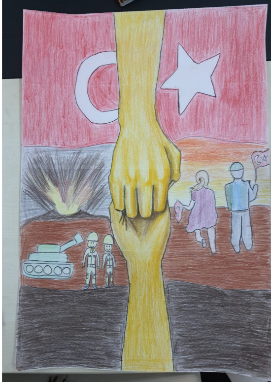
15 TEMMUZ SAAT 22.00

Normal sıradan bir gündü. Sıradan ha? Keşke erken konuşmasaydım. İşten yeni çıkmıştım saat 20.00'a geliyordum. Eve doğru geliyordum. İçimde kötü bir his vardı. İşte çok yorulmuştum. Yorgunluğuma verdim ve eve geldiğimde saat 21.00'ü bulmuştum. Eve gelip hemen uyumak istiyordum. Ancak hiçbir şey görür görmez anahtarımı alıp dışarı çıktım. Bütün halk dışarıdaydı. Hiç kuşku, korku duymadan Boğaziçi Köprüsü'ne doğru yürüyor, koşuyorlardı. Vatana onlara vermeye hiç niyetleri yoktu tabi benim de. Tankların, silahların önüne yattılar çoluk çocuk, yaşlı genç herkes meydandaydı. O gün vatanımızı onlara teslim etmedik bugün de vermeyiz. İnsanın namusu neyse vatanın namusu da odur. Namusunu nasıl korursa vatanını da öyle korur.